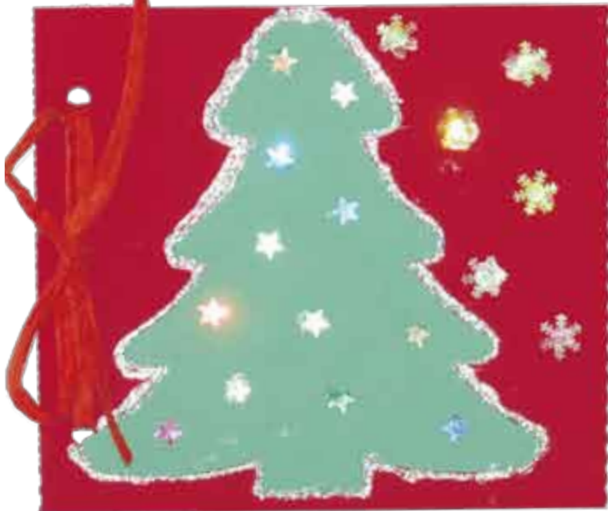
Kartka wykonana przez ucznia Zespołu Szkół im. Jana Pawła II w Łazach